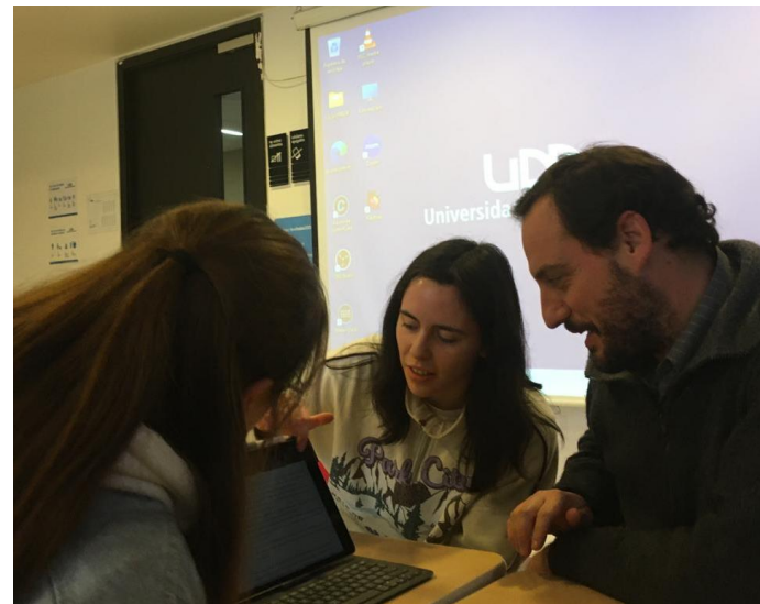
Tutoría equipo Desafío Puelo Cochamó (jueves 27/6/2024)